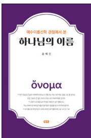
‘예수이름신학총서’ 4 『예수이름신학 관점에서 본 하나님의 이름』 저자: 윤혜진, 출판일: 2021. 2.